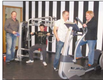
Modernste Geräte für ein effektives Training: Demnächst wird das ganze Studio neu ausgestattet.

Wer lieber in der Gruppe Sport treibt, als