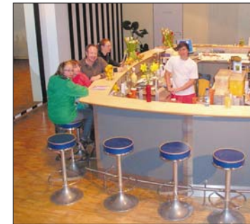
Entspannung nach dem Training: Der neue Thekenbereich.

Der große Erfolg liegt nicht zuletzt auch an der Flexibilität, die man als Hardy's-Kunde genießt. Die Clubs sind jeden Tag im Jahr geöffnet, während der Woche von sechs bis 23 Uhr, an den Wochenenden von neun bis 21 Uhr. Mitglieder haben die Möglichkeit, Verträge über drei, sechs, zwölf, 18 oder 24 Monate abzuschließen. Und wer erst einmal zum Ausprobieren kommen möchte, hat die Wahl zwischen Tagespässen und 12er-Karten.